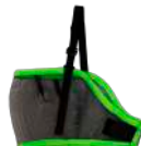
COD: M363 (CABALLO)