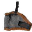
COD: M373C (CABALLO)